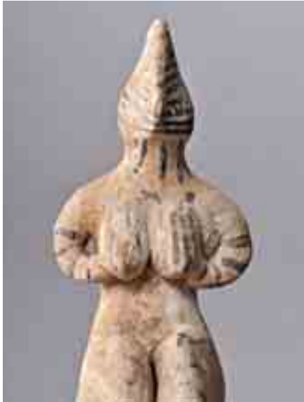
Idol aus Mesopotamien