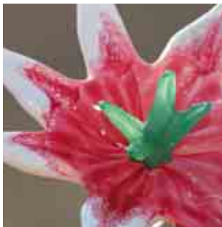
Am Ofen modellierte Blüte aus Glas.

Thementag (Vorführung): modellazione di fiori – Blüten aus Glas. Torsten Röttsch zeigt, wie aus dem heißen Glas Blumen und andere kunstvolle Applikationen geformt werden. Geschwindigkeit und viel Übung sind nötig, um die verspielten Elemente frei Hand zu erschaffen. Eintritt frei (Internationaler Museumstag)