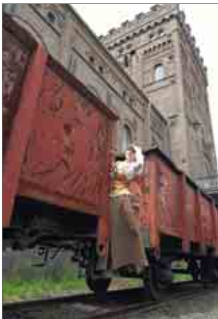
Jugendkultur heute - Steampunk