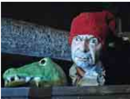
Theater: Kasperls Wurzeln