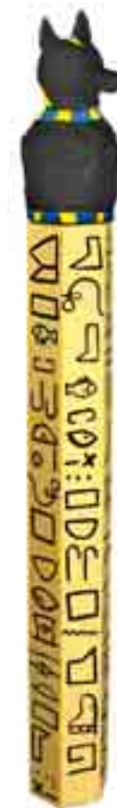
Eine Anubis-Steele nach altägyptischem Vorbild, Gesamtschule Kamen, 2014

Alter: Sekundarstufe I und II Dauer: 3 Unterrichtseinheiten Teilnehmerzahl: Klassenstärke Kosten: 50 €/Stunde zzgl. Fahrtkosten ab 20 km Anfahrt Mindestens eine Lehrperson muss während des Unterrichtsbesuchs als Aufsicht ständig anwesend sein