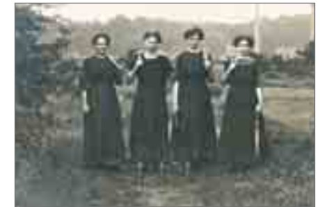
Frauen halfen im Ersten Weltkrieg auf der Hütte aus. Die von ihnen gefertigten Granatenhülsen dienen hier als Vase.