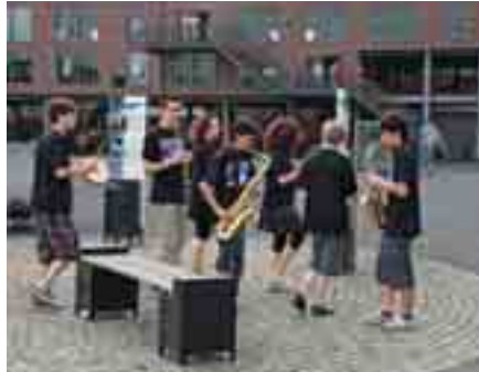
Ruhrgebietsklänge auf Zeche Zollern, 2010