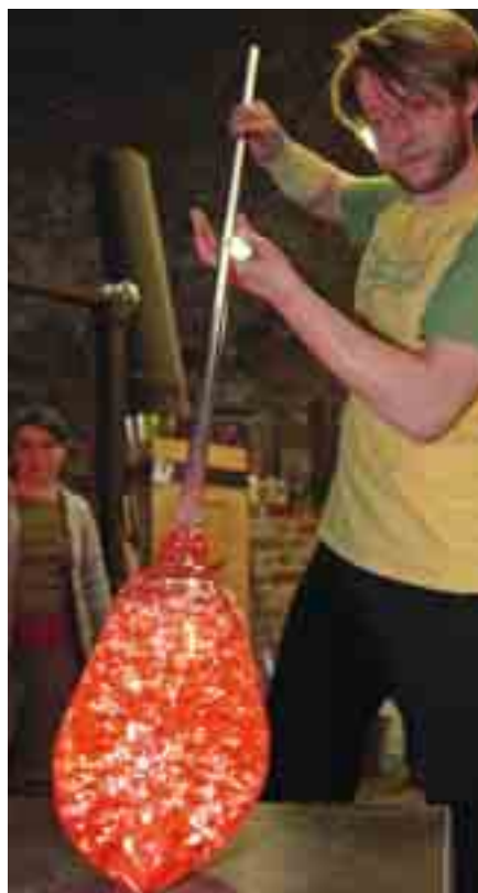
Herstellung einer Millefiorivase.