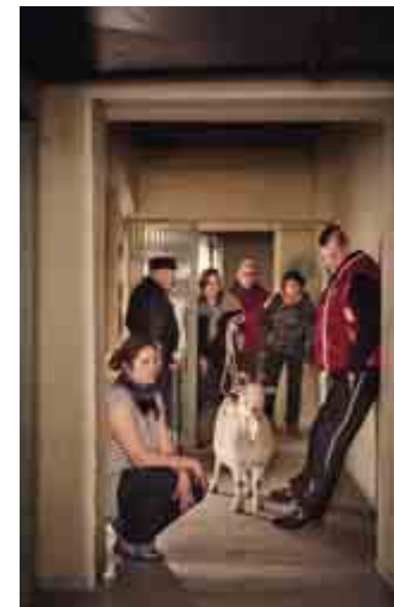
Künstlerische Inszenierung in der Zivilschutzbefehlsstelle

Ort der Abfahrt: Zeche Zollern Anmeldung unter: Tel.: 0231 6961-176, Fax: 0231 6961-144, oder unterwelten-projekt@lwl.org Kosten: 35 € inkl. Ausstellungsführungen und Bustour