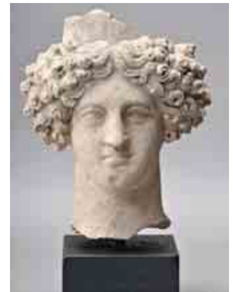
Kopf der antiken Unterwelts-Göttin Persephone