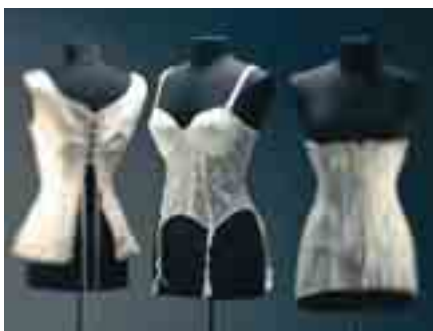
Reiz und Scham. 150 Jahre Kulturgeschichte der Unterwäsche.

So, 14.9., 11–17 Uhr Tag des offenen Denkmals. Führungen durch die Spinnerei, Soundseeing V und die übrigen Sonderausstellungen, Detektivralleye und Maschinenvorfürungen. Kosten: Eintritt frei, Teilnahme an der Rallye pro Familie 3 €