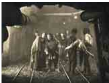
Film: Schlagende Wetter