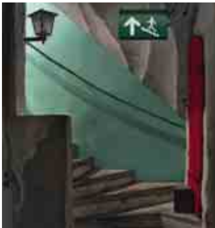
„Kellertreppe“ von Niklas Hughes, 2011