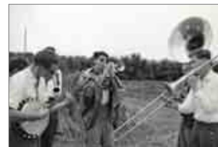
Bildvortrag: Hallo Fräulein ist kein Jazz

Do, 3.7., 19 Uhr Bildvortrag: Hallo Fräulein ist kein Jazz! Über wahren Jazz, Massenmedien und Jugendkultur während und nach dem Zweiten Weltkrieg. Mit Dr. Uta C. Schmidt. kostenfrei