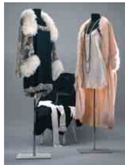
Dessous der 1920er Jahre.

Welche Partien des weiblichen Körpers durften in den vergangenen 150 Jahren gezeigt werden und welche nicht? Ball- und Gesellschaftskleider, Strand- und Sportanzüge erzählen von Sittlichkeits- und Tugendvorstellungen ihrer Zeit und dem Spiel mit körperlichen Reizen. Erotik pur verspricht der zweite Teil der Ausstellung zum Thema Dessous. Auch das „Darunter“ hat sich im Laufe der Zeit erheblich gewandelt. Der Bogen reicht vom Liebestöter bis zum Hauch von Nichts unserer Tage. Die Ausstellung ist eine Übernahme aus dem LVR-Industriemuseum.