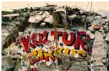
Führung: Vom Rock'n Roll zur Hausbesetzung

So, 11.5., 16–17 Uhr Offene Führung durch die Sonderausstellung „Jugendliche Subkulturen“. kostenfrei