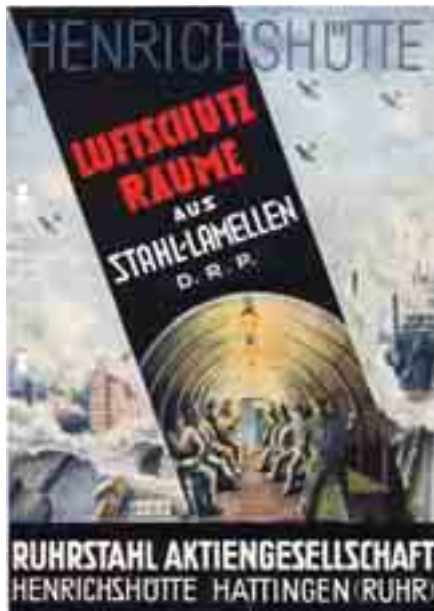
Ein Produkt der Henrichshütte im Krieg: Mit diesen Stahllamellen wurden unterirdische Schutzräume gebaut.

In beiden Weltkriegen produzierte die Henrichshütte für den Krieg. In den Betrieben entstanden Granaten, Kanonenrohre und Panzerplatten. Als Tod und Verwüstung zurückkamen, boten die „Unterwelten“ des Hüttenwerks Schutz. Am Beispiel der Henrichshütte und ihrer Kriegsproduktion thematisiert die Ausstellung die zentralen Themen Rüstung und Zerstörung, Macht und Ohnmacht, Leid und Tod. So berührt die Präsentation Kernfragen und Urängste des menschlichen Daseins.