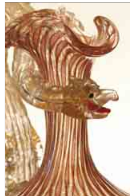
Karaffe mit Drachendekor, Salviati, 1890

Die Ausstellung führt zu den einst weltberühmten, jetzt größtenteils stillgelegten Glashütten vor Venedig und gibt spannende Einblicke in die vergangene und gegenwärtige Glasherstellung. Die Aufnahmen aus dem Jahr 2011 dokumentieren drei Glashütten, die entweder stillgelegt wurden, ihren Betreiber wechselten oder ihre vergangene Größe aufgrund der Marktverhältnisse in eine kleinere Produktionsstätte umwandelten.