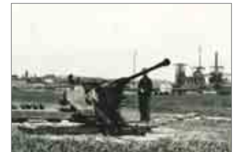
Flakstellung vor den Toren der Henrichshütte. Dieser Posten sollte das Werk vor feindlichen Fliegern schützen.

Nähere Informationen auch zum angebotenen Filmprogramm unter: www.lwl-industriemuseum.de