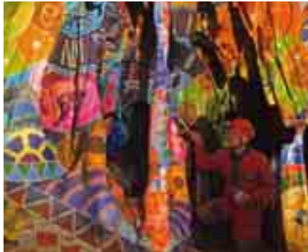
Moderne Höhlenmalerei – Ein Gewinnermotiv des Online-Votings aus dem Fotowettbewerb „Meine Unterwelten“, 2013 | Foto: Rasmus Dreyer

U-Bahn-Fahrer und Bergmann, Lehrerin und Schüler, Historiker und Geologe – jeder trägt seine eigenen Vorstellungen von Unterwelten mit sich herum. Die Ausstellung „Über Unterwelten“ fragt nach dieser Vielfalt und lädt mit ihren Angeboten Jung und Alt zum Mitmachen und Diskutieren ein.