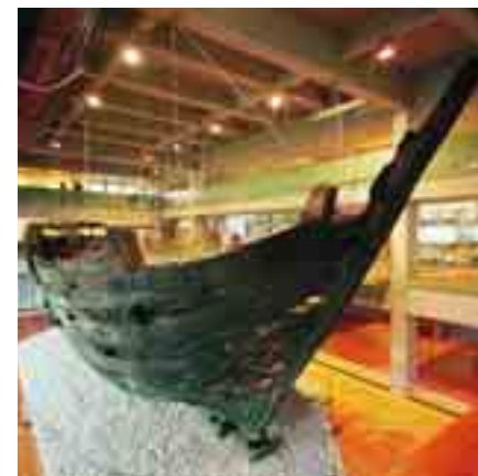
Hansekogge im Deutschen Schiffahrtsmuseum

Fast 600 Jahre lang lag sie im Schlick der Weser, dann stießen Bauarbeiter bei der Erweiterung des Hafens auf ein Schiffswrack. Über 2.000 Teile wurden im Laufe mehrerer Jahre geborgen, datiert, konserviert und zusammengesetzt. Die „Hansekogge“ gilt als Meilenstein der deutschen Unterwasserarchäologie.