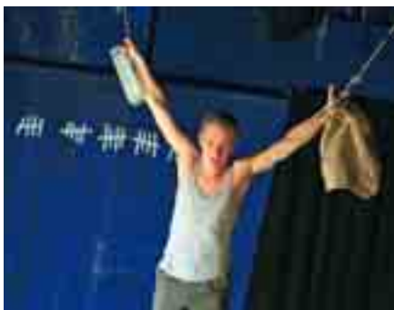
Theater: Traum eines lächerlichen Menschen

Reservierung unter: Tel.: 0231 6961-176, Fax: 0231 6961-144, oder unterwelten-projekt@lwl.org Kosten: 8 €, ermäßigt 6 €