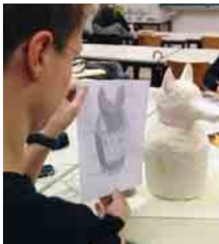
Beim Unterrichtsbesuch entstehen Exponate für „Über Unterwelten“, Gesamtschule Kamen, 2013