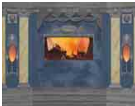
Vorführung des Eidophusikon