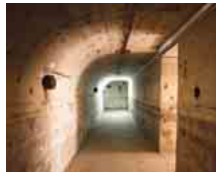
Der Bunker in der Tullstraße