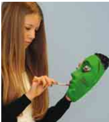
Schülerin der Droste-Hülshoff Realschule in Dortmund und ihre Masken zu Über- und Unterweltenwesen, 2014