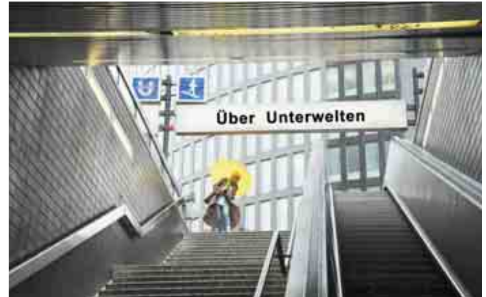
Alltäglicher Abstieg in den Untergrund

„Über Unterwelten“ spricht alle Menschen an, die Spaß am Staunen haben und Lust verspüren, ihre Welt einmal aus neuer Perspektive zu betrachten: von unten.