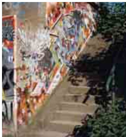
Graffiti Workshop

Sa, 31.5. und So, 1.6., 12–17 Uhr Graffiti Workshop mit Streetart-Künstler Markus Wiese. Anmeldung: erforderlich unter Tel.: 0234 6100-874 Kosten: 8 €