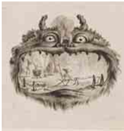
Radierung aus: „Das Palladion“, heroisch-komisches Gedicht von Friedrich II. von Preußen (1749), Herzog Anton Ulrich Museum, Braunschweig