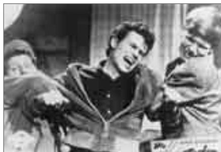
Film: Die Halbstarcken

So, 18.5., 17.8., 16–17 Uhr Themenführung: Vom Rock'n Roll zur Hausbesetzung. Jugendkulturen in den 1950er bis 1980er Jahren. kostenfrei