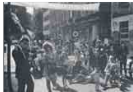
Film: Tanz auf dem Vulkan