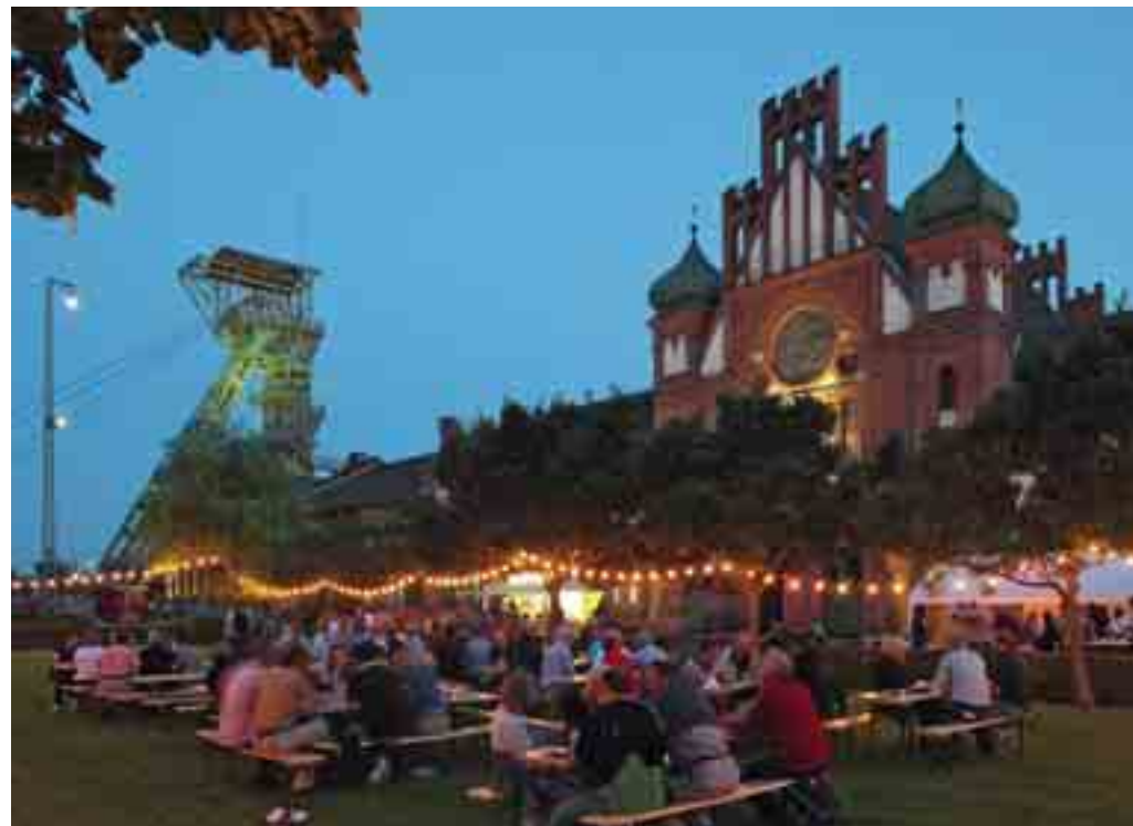
ExtraSchicht auf der Zeche Zollern

Nähere Infos zu Programm und Eintritt unter www.extraschicht.de