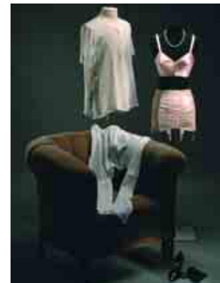
Unterwäsche der 1950er Jahre.

Eröffnung der Ausstellung „Reiz & Scham. Kleider, Körper und Dessous“. kostenfrei