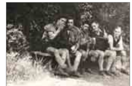
Führung: Wandervogel und Bündnische Jugend

Mo, 21.4. und So, 27.7., 16–17 Uhr Themenführung: Wandervogel und Bündnische Jugend. Jugendbewegungen 1900–1945. kostenfrei