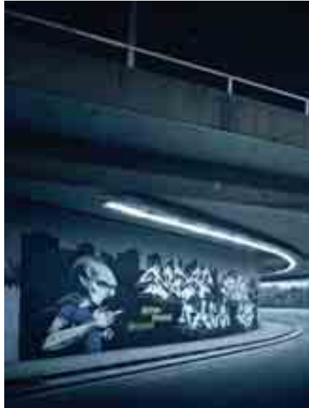
Graffitis unter einer Unterführung an der Ruhr-Universität Bochum, 2009