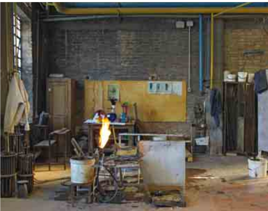
Arbeitsplatz in der Glashütte von Gino Cenedese.

Das Glas wird an der Bank mit dem Handbrenner auf Temperatur gehalten und bearbeitet.