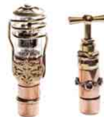
Workshop: Speicherröhren selbst gemacht

Do, 17.7., 18–21 Uhr Workshop: Speicherröhren selbst gemacht. Mit einer Einführung in die Welt des Steampunk. Unter Anleitung erfahrener Steampunker werden USB-Sticks zu „Speicherröhren“ im viktorianischen Stil umgebaut.