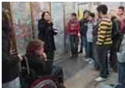
Gebärdendolmetschen für Schülerinnen und Schüler

Kostenlose öffentliche Führung mit Anmeldung für Hörende und Ge- hörlose mit Gebärdendolmetscherin sowie mit einer Personenführungs- anlage auch für gehörgeschädigte Menschen.