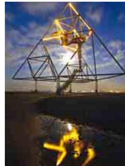
Tetraeder. Geheimnisvolles Ruhrgebiet (2009)