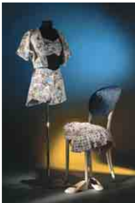
Badeoutfit der 1950er Jahre.

Sa, 26.7., 15–16 Uhr Integrative Führung für Hörende und Gehörlose mit einer Gebärdendolmetscherin durch die Sonderausstellung „Reiz & Scham“. Kosten: nur Museumseintritt