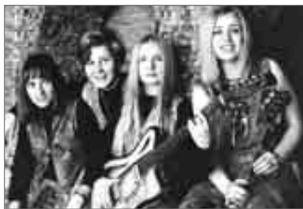
Musikalische Lesung: RuhrgeBEATsgirls, hier: RagDolls