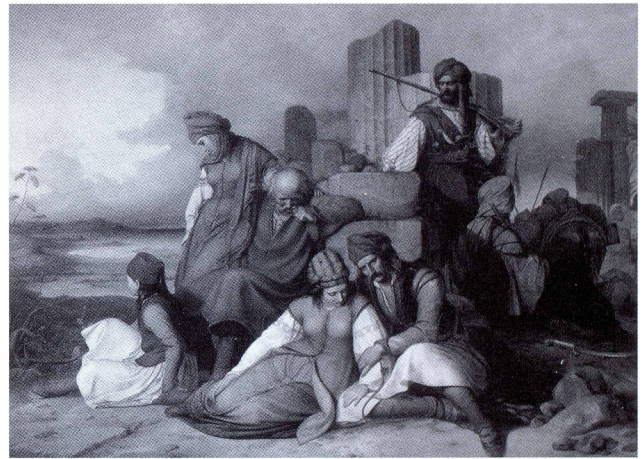
Abb. 1: Adolf Teichs, Gefangene Griechen von Mamelucken bewacht, 1836, Öl/Leinwand, 185,5 x 247,5 cm, Inv.-Nr. 332 WKV, Leihgabe des Westfälischen Kunstvereins, erworben 1838 als zweites Werk zeitgenössischer Kunst

Adolf Schmidt's Milchmädchen ist also nicht die naive, sondern die tüchtige junge Frau – und ist darin wegweisend modern. Arbeitsamkeit als bürgerliche Tugend wird – während im Wuppertal die Industrialisierung einsetzte und Kinderarbeit üblich war – auch dem weiblichen Geschlecht zu-