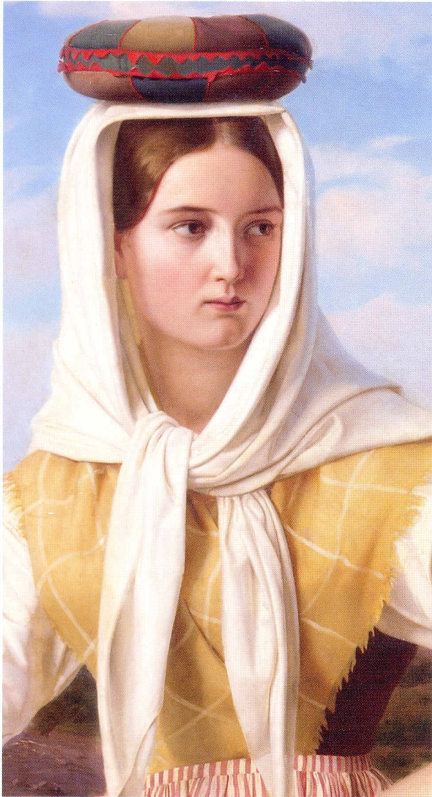
Abb. 2: Ausschnitt