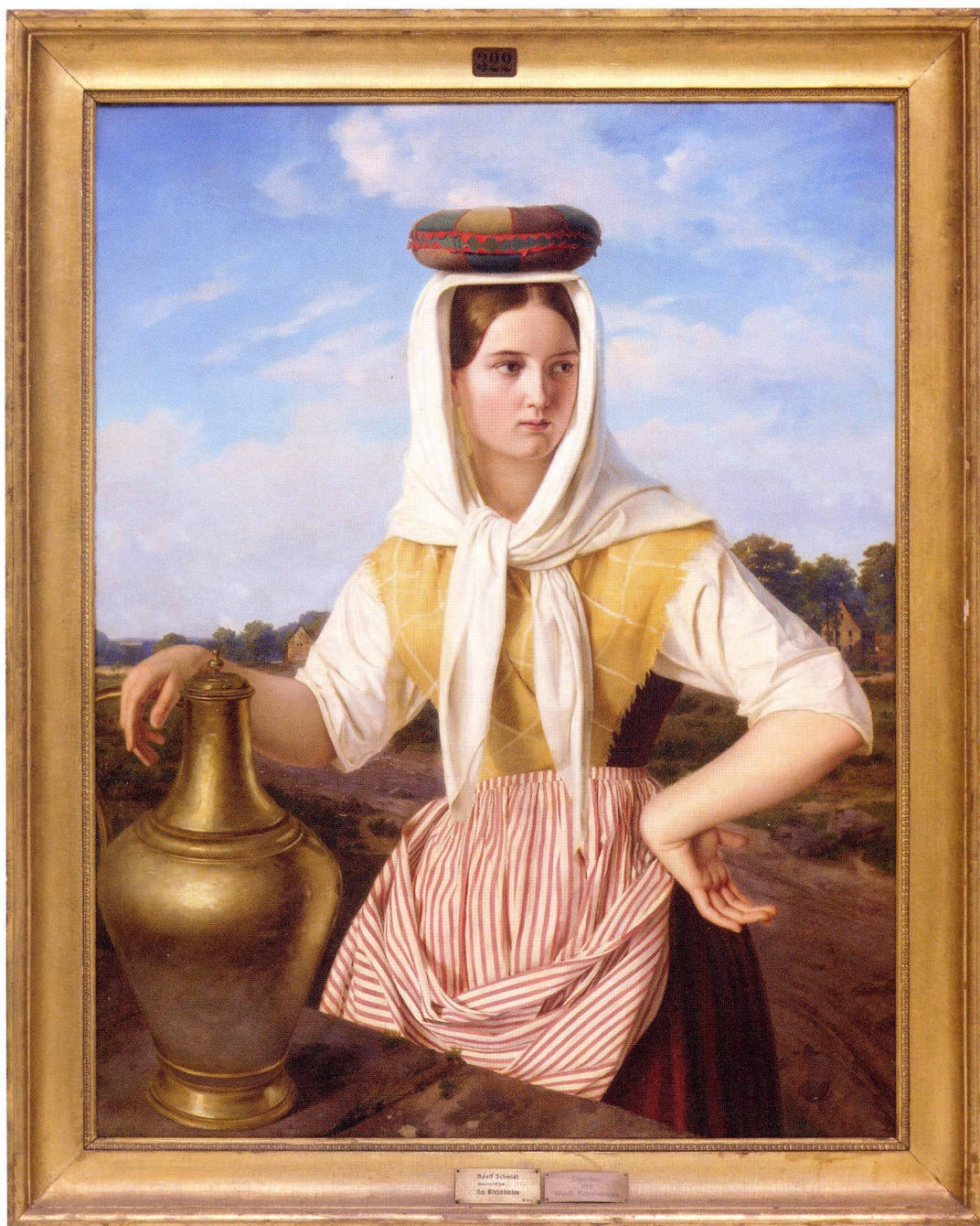
Adolf Schmidt (1804 – 1864?) Das Milchmädchen, 1834 Öl/Leinwand, 112,2 x 87 cm, Rahmen 127,5 x 103,5 x 8,5 cm Inv.-Nr. 322 WKV, Leihgabe des Westfälischen Kunstvereins, erworben 1835