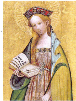
Abb. 4: Conrad von Soest, Die hl. Odilia, um 1410, Öl/Holz, 93 x 25,8 cm (Ausschnitt), Inv.-Nr. 3 WKV, Leihgabe des Westfälischen Kunstvereins, erworben 1835

Paul de Kock, La laitière de Montfermeil, Paris 1827 (dt. Das Milchmädchen von Montfermeil, Braunschweig 1829, u. a.)