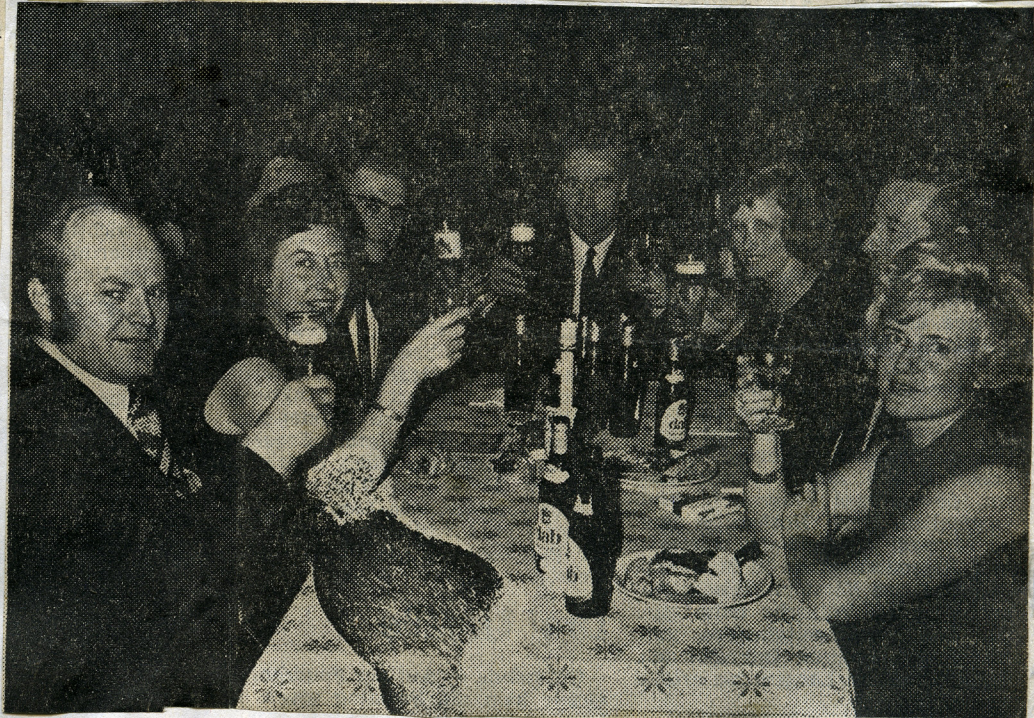
Deutsch-englische Party im Waldschlößchen Marienfeld: Der Austausch von Geschenken und das freundschaftliche Zutrosten waren Zeichen gut nachbarschaftlicher Beziehungen.